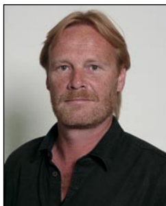
Af Lars Jørgensen, freelancejournalist

VANCOUVER: Dommen over 18 danske atlethers deltagelse i de 21. olympiske vinterlege var nådesløs. Allerede efter kun fem konkurrencedage, og endnu inden alle danskerne havde været i ilden i Vancouver, blev nationens udvalgte ristet over den olympiske flamme hjemme i Danmark.