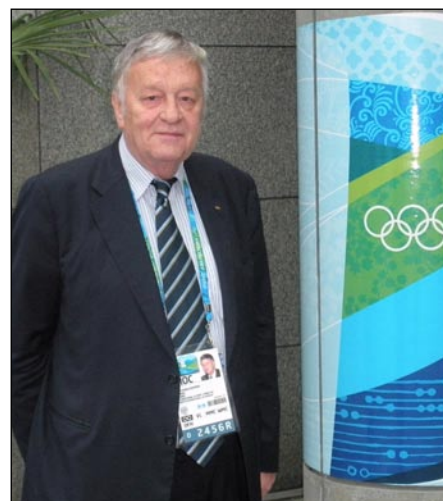
Gian-Franco Kasper: OL bør tilbage i bjergene.

"Det bedste ville være slet ikke at have tilskuere i bjergene, fordi en meget stor